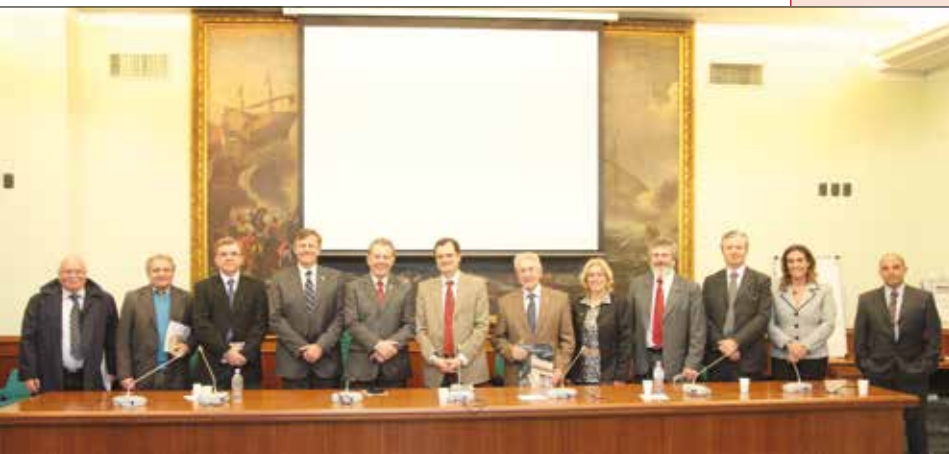
■ Porta nell'incontro con la delegazione di SC.

matario di una interrogazione parlamentare al Ministro dell'Interno sui diritti di cittadinanza dei figli di genitori irregolari. ■ Ordini del Giorno, Lettere e Appelli ● Firmatario dell'Ordine del Giorno approvato dalla Camera in materia di interventi a sostegno della popolazione civile siriana e dei profughi del conflitto; ● Lettera di augurio al nuovo Sindaco di New York, Di Blasio, sottoscritta insieme agli altri deputati eletti all'estero del Partito Democratico; ● Promotore dell'appello, sottoscritto da 14° deputati e senatori italiani, per la costruzione di un monumento a Roma in ricordo del martirio di Monsignor Oscar Romero, Arcivescovo di San Salvador. ■