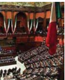
TARE DEL DEPUTATO